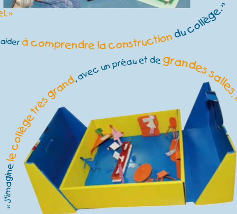
« J'imagine le collège très grand, avec un préau et de grandes salles. »