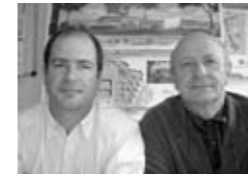
Mostini et Mostini, architectes et associés " Pour une architecture durable..."

Le projet de collège s'inscrit harmonieusement dans le site et minimise son impact sur l'environnement. Dès l'origine, les données climatiques et urbanistiques ont guidé notre réflexion. Les zones d'habitat, l'école élémentaire, l'exposition aux vents dominants d'Ouest, la recherche d'une orientation favorable Nord - Sud pour les salles d'enseignement ont dicté l'implantation des différents éléments du programme.