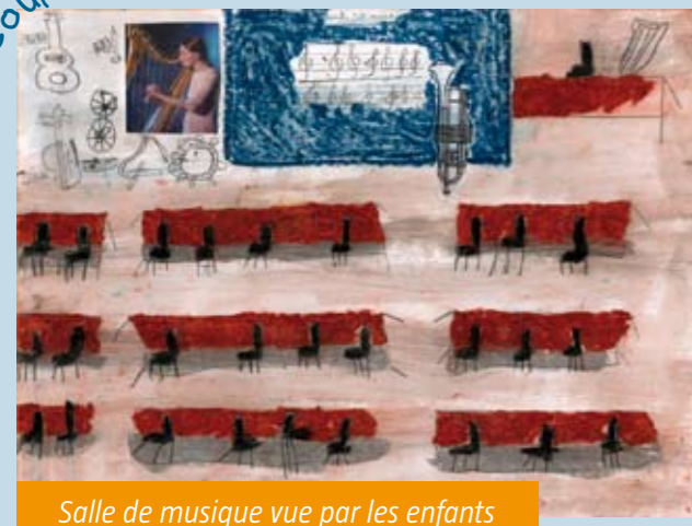
Salle de musique vue par les enfants