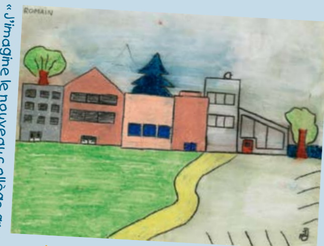
« J'imagine le nouveau collège grand, spacieux, tout neuf avec un grand jardin naturel. »