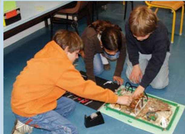
Imaginer l'espace grâce à une boîte à chaussures